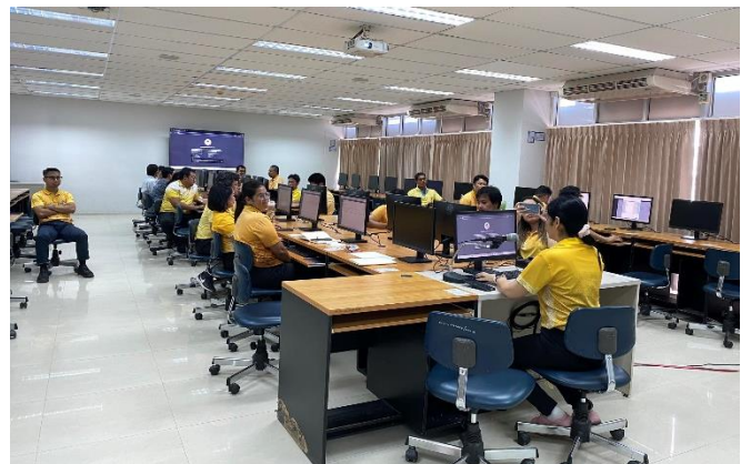
รูปประกอบการจัดกิจกรรมแลกเปลี่ยนเรียนรู้ระบบพัสดุ (วัสดุ) การจัดการความรู้ km ประจำปี ๒๕๖๖ ครั้งที่ ๒