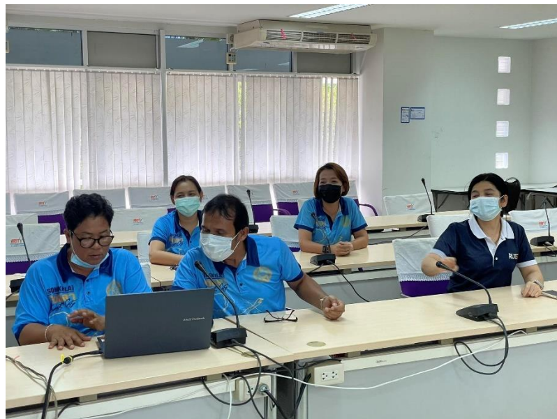
ภาพประกอบการจัดกิจกรรมการแลกเปลี่ยนเรียนรู้ การจัดการความรู้ km